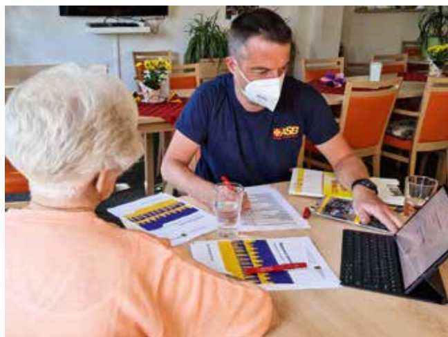
Von der Reittherapie für traumatisierte Kinder bis zur Unterstützung vulnerabler Geflüchteter im Behördendschungel reichen die Hilfen des ASB.