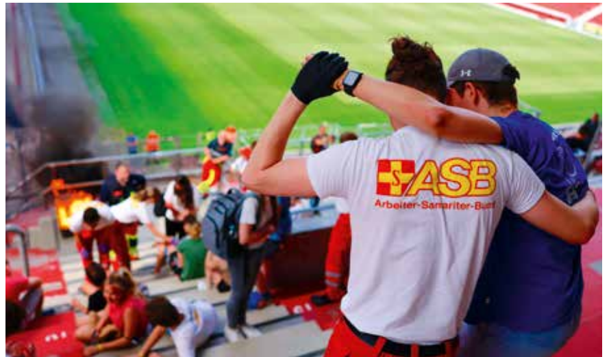
Um den Ernstfall zu simulieren, wurden im Stadion Feuerwerkskörper gezündet.

In der VIP-Lounge der MEWA ARENA wird die Übung von mehreren Kameras live übertragen und von einem ASB-Experten kommentiert und moderiert – unter den zahlreichen Gästen ist der rheinland-pfälzische Innenminister Roger Lewentz, außerdem Vertreter:innen der Hilfsorganisationen, des Bundesamtes für Bevölkerungsschutz und Katastrophenhilfe (BBK), aus Polizei, Wissenschaft und Behörden. Auf dem Bildschirm ist eine junge Patientin mit einer Kopfverletzung zu sehen, der ein fiktives Schmerzmittel verabreicht wird. Auch sie ist von der Übung beeindruckt, die insgesamt über vier Stunden