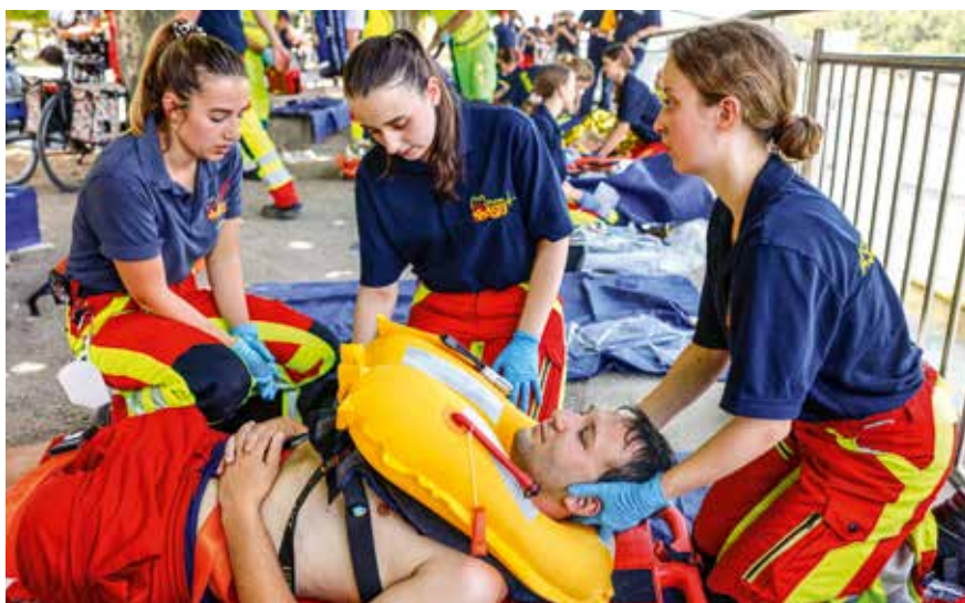
Versorgung Verletzter, die nach dem Unglück aus dem Rhein gerettet wurden.