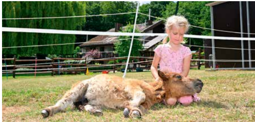
Traumatisierten Kindern gibt der Kontakt zu den Pferden wieder Sicherheit.