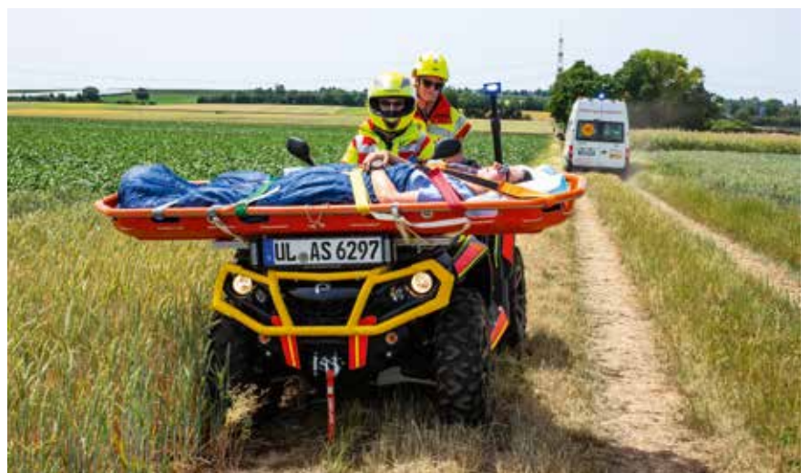
Die Quadstaffeln kamen im unwegsamen Gelände zum Einsatz.

dauert. „Die Geräuschkulisse mit den Explosionen war realistisch“, meint die junge Frau. „Die Rettungskräfte sind sehr kollegial, immer freundlich und lassen den Stress nicht an sich heran.“ Auch Rettungshunde-Teams aus Baden-Württemberg, Hamburg und Niedersachsen sind bei der Bundesübung im Einsatz und helfen bei der Suche nach Vermissten. Das Szenario sieht vor, dass einige Fußballfans in Panik aus dem Stadion in ein nahes Waldstück laufen. Nur mithilfe der Rettungs-