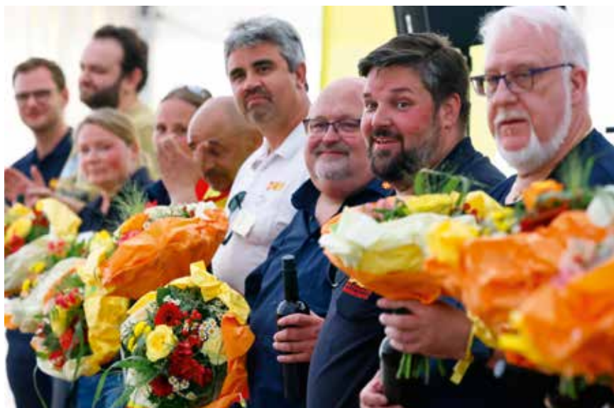
Abschlussveranstaltung mit Dank an alle Organisator:innen und Einsatzkräfte.